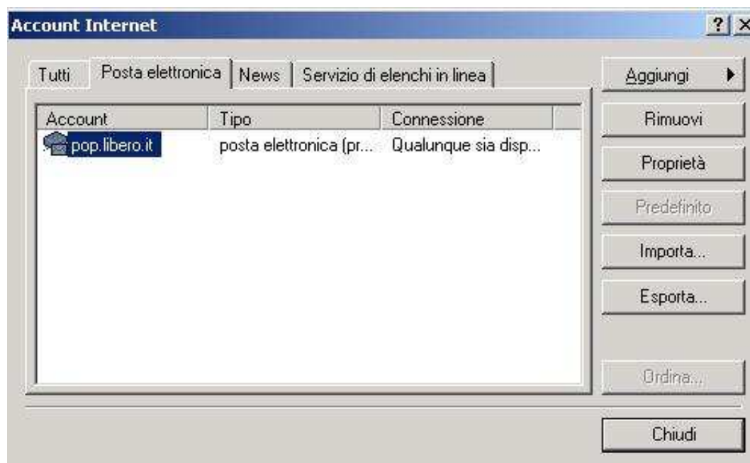
Figura 2: settings