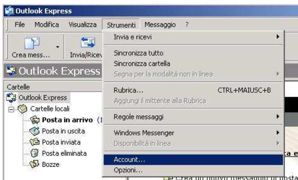
Figura 1: main