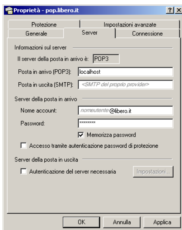
Figura 3: server